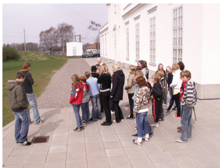
Många skolklasser besökte Grimeton under Vetenskapsfestivalen.

Göthrik är den skola som ligger närmast radiostationen och där har man ett väl etablerat samarbete med Världsarvet. Till samma skoldistrikt hör Rolfstorps skola och på Världsarvet hoppas man kunna engagera även den skolan i radiostationens verksamhet.