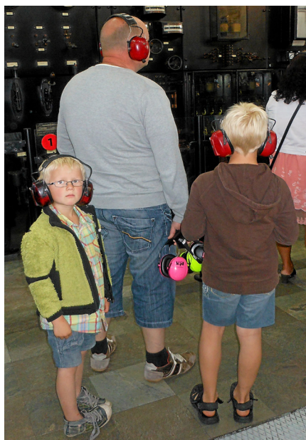
Sommarens tisdagskvällar lockade både barn och vuxna.