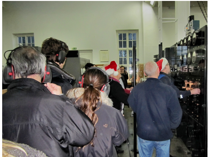
Intresserade åskådare övevakar sändarstarten.

Julaftonsmorgonen bjöd på vinterväder med den inskränkningen att snön lyste med sin frånvaro. En vacker slöja av rimfrost täckte det mesta så även sändarmasterna och antennerna. Detta förmodades vara orsaken till att sändareffekten var tämligen modest omedelbart efter starten. Förhållandet förbättrades succesivt och bedömdes som acceptabelt när det var dags att sända ut julhälsningen.