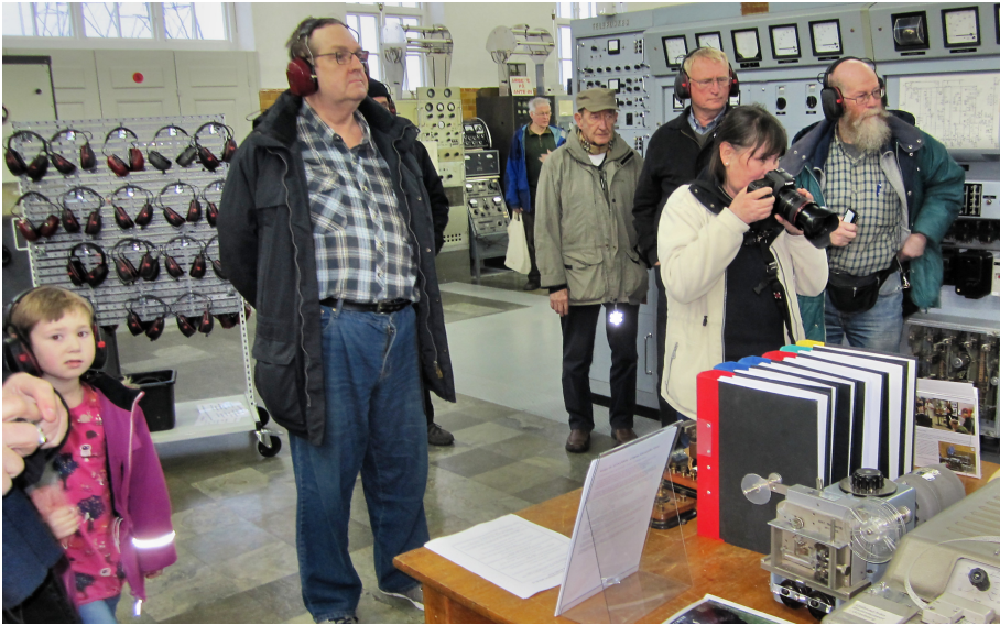
Intresserade besökare följer utsändning av meddelandet.