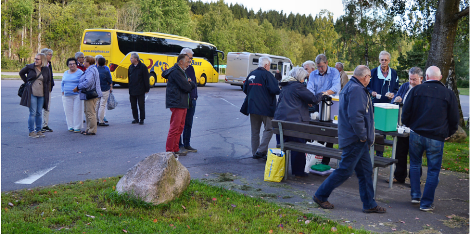
Frukostfralla intogs på Hallandsåsen.

Klockan 7:30 den 2:a september startade ett trettiotal Alexandermedlemmar och några representanter för Världsarvet resan. Första stoppet var Hallandsåsen där frukostfrallor inmundigades. Kosan styrdes sedan till Hörby radiomuseum. Efter besöket på radiomuseet intogs en välsmakande lunch på Ringsjö Wårdshus. Eftermiddagen ägnades åt ett besök på det museum som anlagts i Birgit Nilssons föräldrahem. På hemvägen gjordes en improviserad avstickare till Skottorp där man kunde inhandla sin favoritost. Alla deltagare var överens om att livet berikats med en synnerligen givande upplevelse.