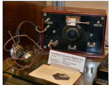
Läge för nostalgi på Hörby radiomuseum

Klockan 7:30 den 2:a september startade ett trettiotal Alexandermedlemmar och några representanter för Världsarvet resan. Första stoppet var Hallandsåsen där frukostfrallor inmundigades. Kosan styrdes sedan till Hörby radiomuseum. Efter besöket på radiomuseet intogs en välsmakande lunch på Ringsjö Wårdshus. Eftermiddagen ägnades åt ett besök på det museum som anlagts i Birgit Nilssons föräldrahem. På hemvägen gjordes en improviserad avstickare till Skottorp där man kunde inhandla sin favoritost. Alla deltagare var överens om att livet berikats med en synnerligen givande upplevelse.