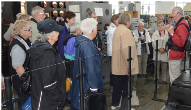
Ola informerar om SAQ

Grimeton. Huvuddelen av aktiviteterna ägde naturligtvis rum inom sändaramatörernas domäner. Vi i Alexander bidrog med en visning av SAQ vari ingick en start av sändaren.