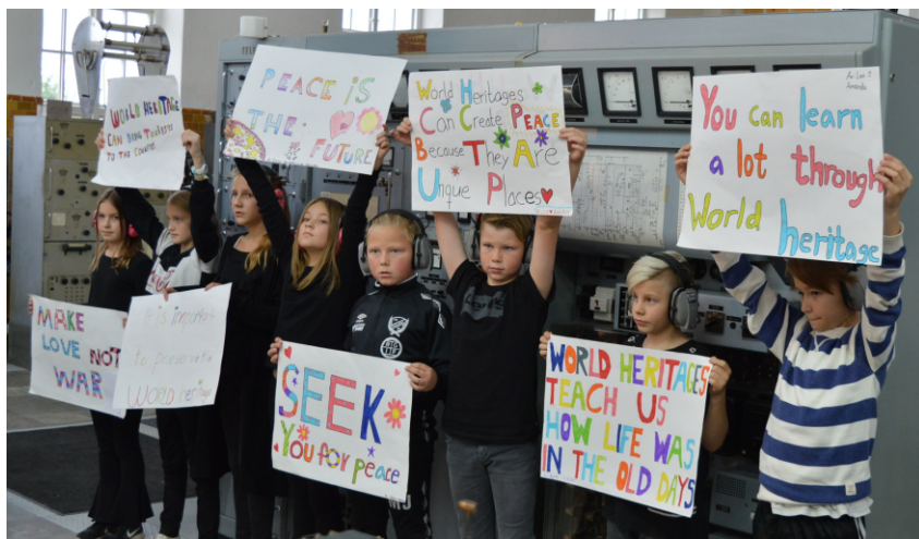
Femteklassare från Göthriks skola manifesterar FN-dagen.