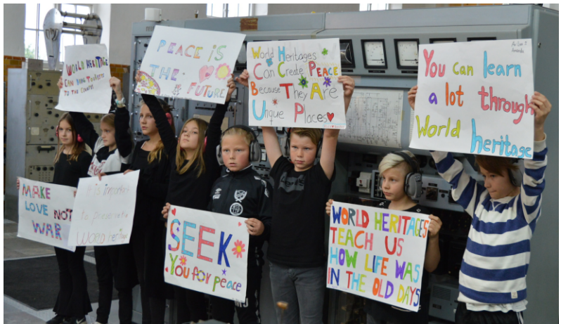
Femteklassare från Göthriks skola manifesterar FN-dagen.

WORLD HERITAGE GRIMETON SEEK YOU FOR PEACE