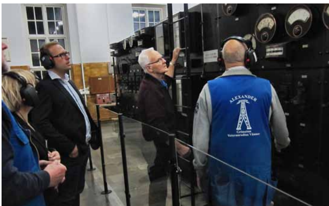
Alexander's Bo och Charlie startar sändaren under landshövdingens överinseende.