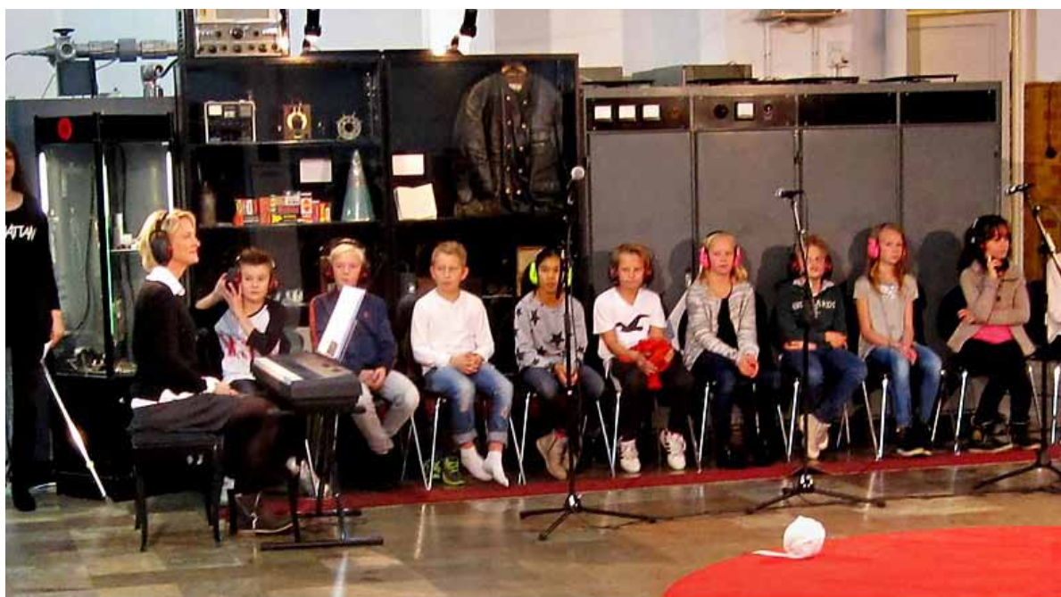
Elever från Påskbergsskolan, framförde musikstycke

Internetsändningen finns på www.unday.org .