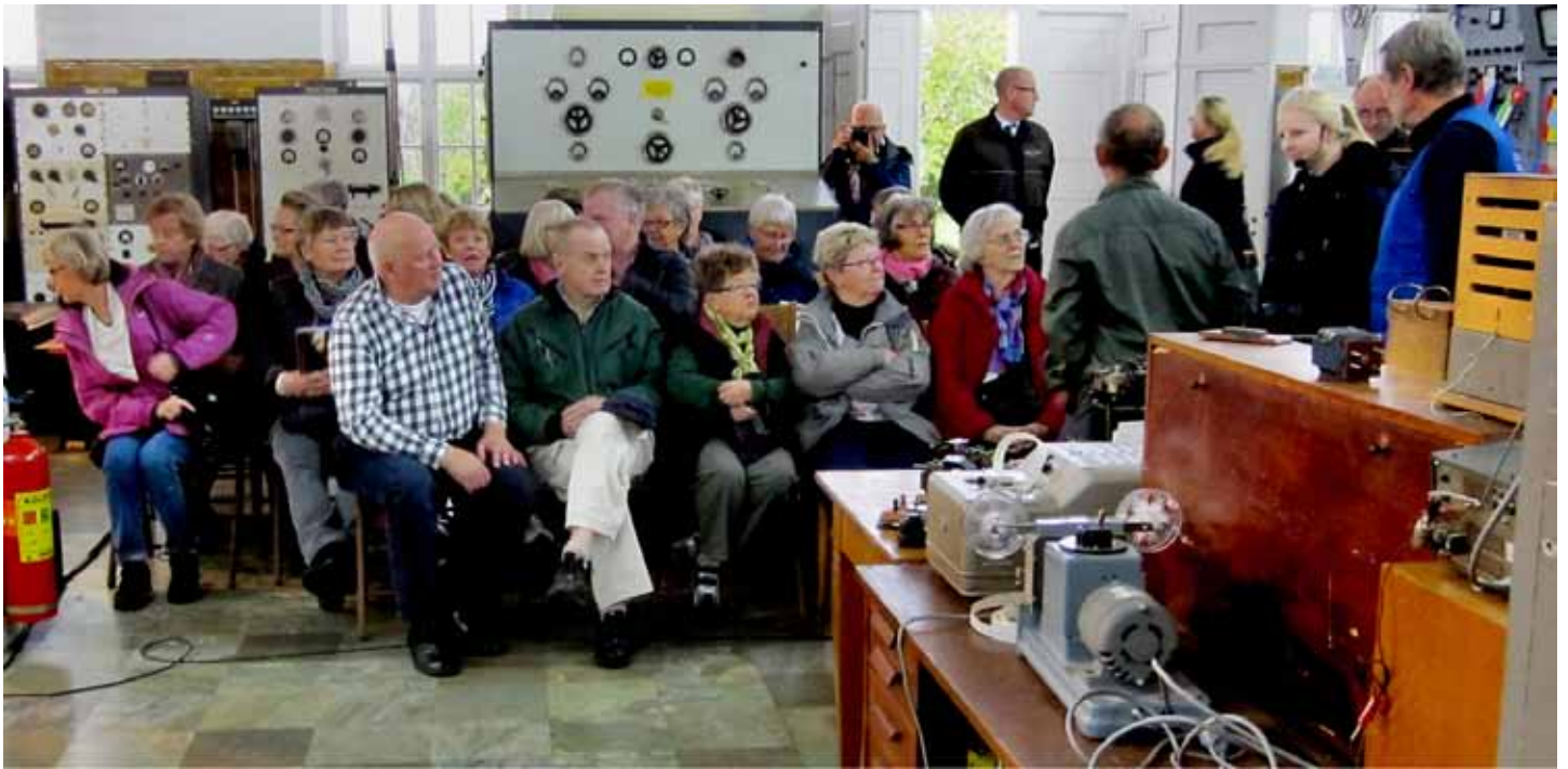
Åskådare väntar på sändarstart