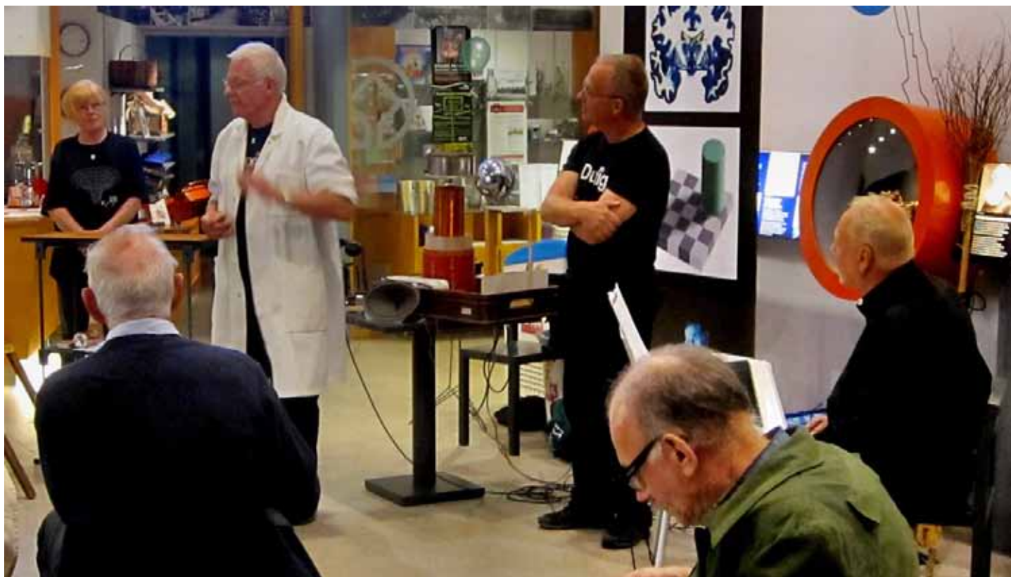
Alkexander's Alternator Band i full frihet.

Efter mötesförhandlingarna inmundigades kaffe med tillugg i Visningshallen där det även bjöds på underhållning som bestod i ”Elektrifierad underhållning med Kammarfysikensembeln”.