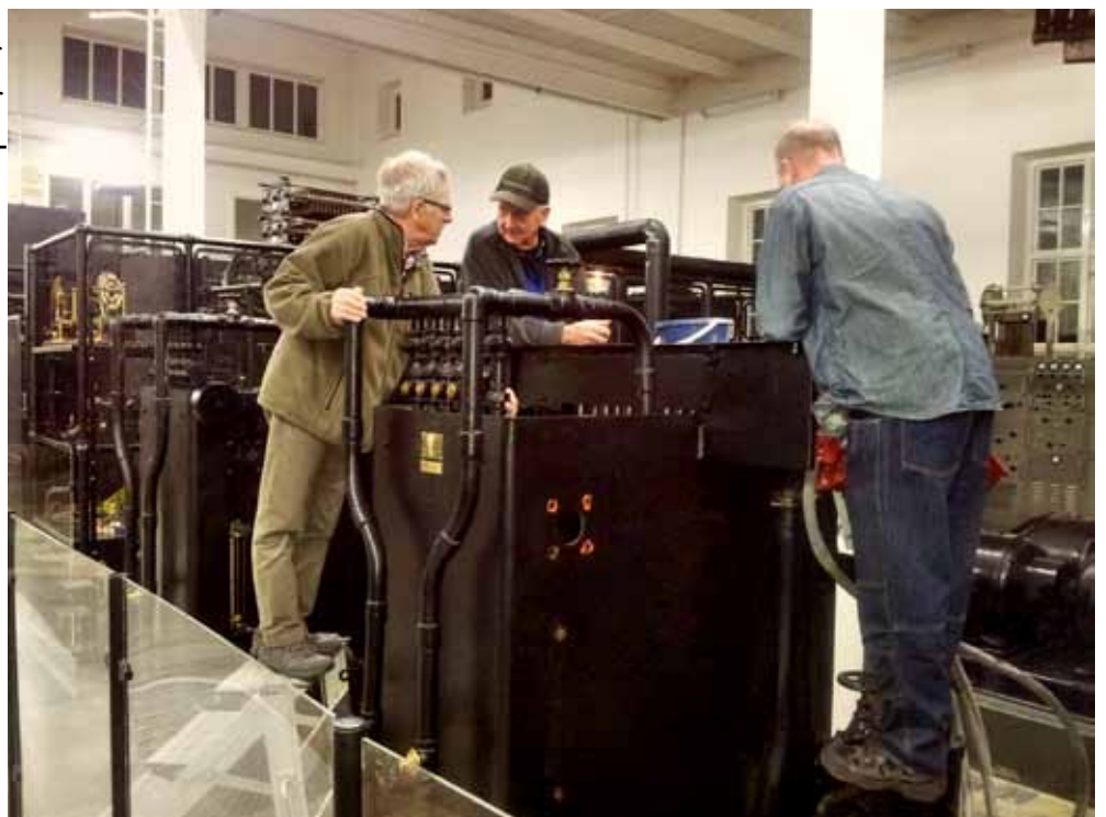
Demontering av komponenter från kärlet till vätskemotståndet

Utöver byte av kärlet för vätskemotståndet kommer även de vanliga periodiska servicearbetena att genomföras.